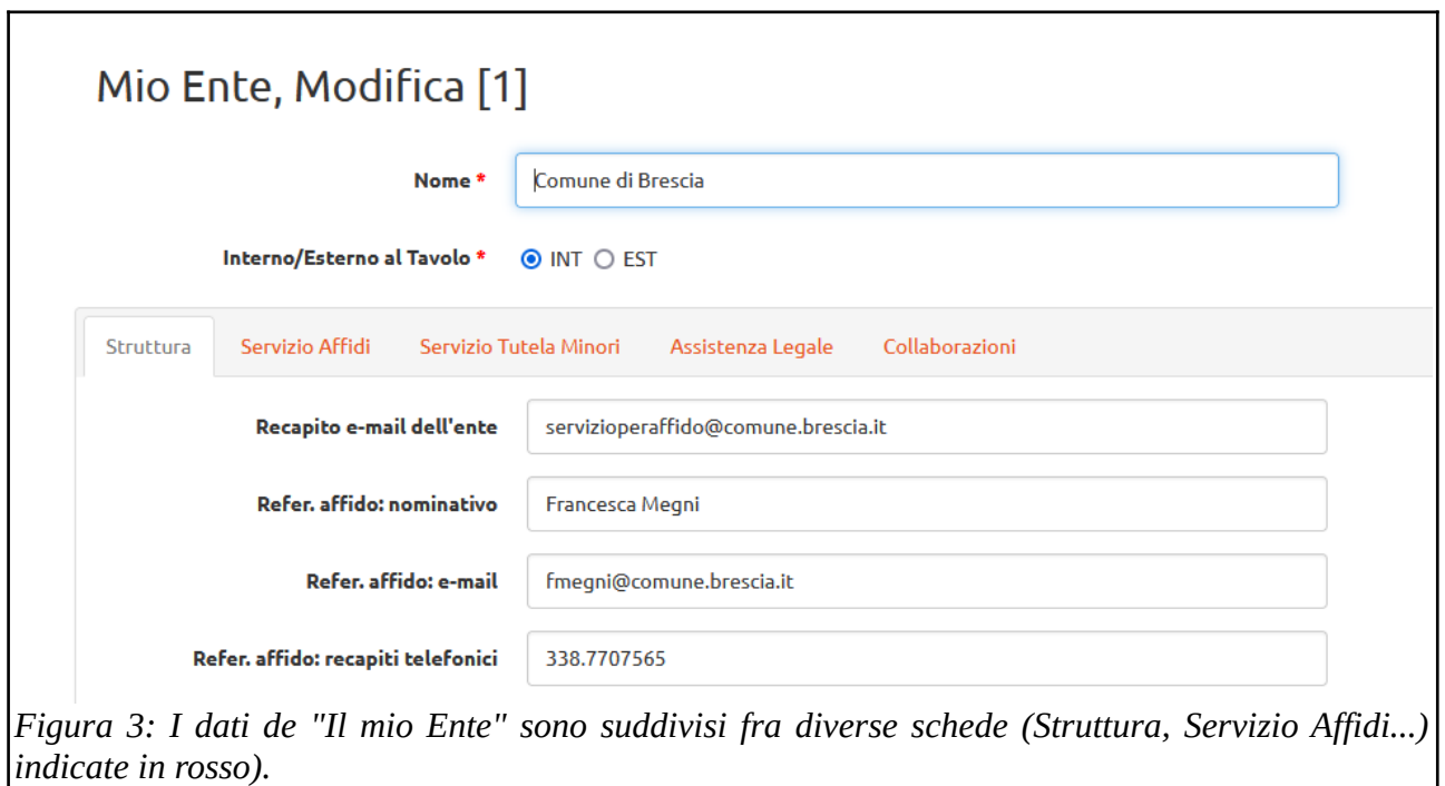
Figura 3: I dati de "Il mio Ente" sono suddivisi fra diverse schede (Struttura, Servizio Affidi...) indicate in rosso).